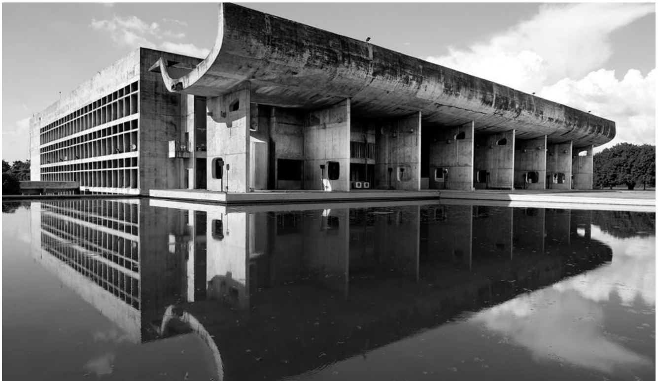
Palacio de la Asamblea, parte del Complejo del Capitolio en de Chandigarh

En definitiva se trata de un viaje cultural, si no la más refinada y elegante expresión del arte y arquitectura, que la elevan a niveles superiores de calidad y riqueza, conectada con las familias de grandes reyes, que como descubriremos, como maharajás estaban rodeados no solo de esos esos niveles de refinamiento y elegancia en cuanto a arquitectura y arte, sino por otro lado llegando a rozar lo divino y sirviendo como conexión al pueblo con esa otra dimensión espiritual tan característica de este pueblo y tierra soberana , a ser descubierta entre maestros de la arquitectura moderna del S. XX .