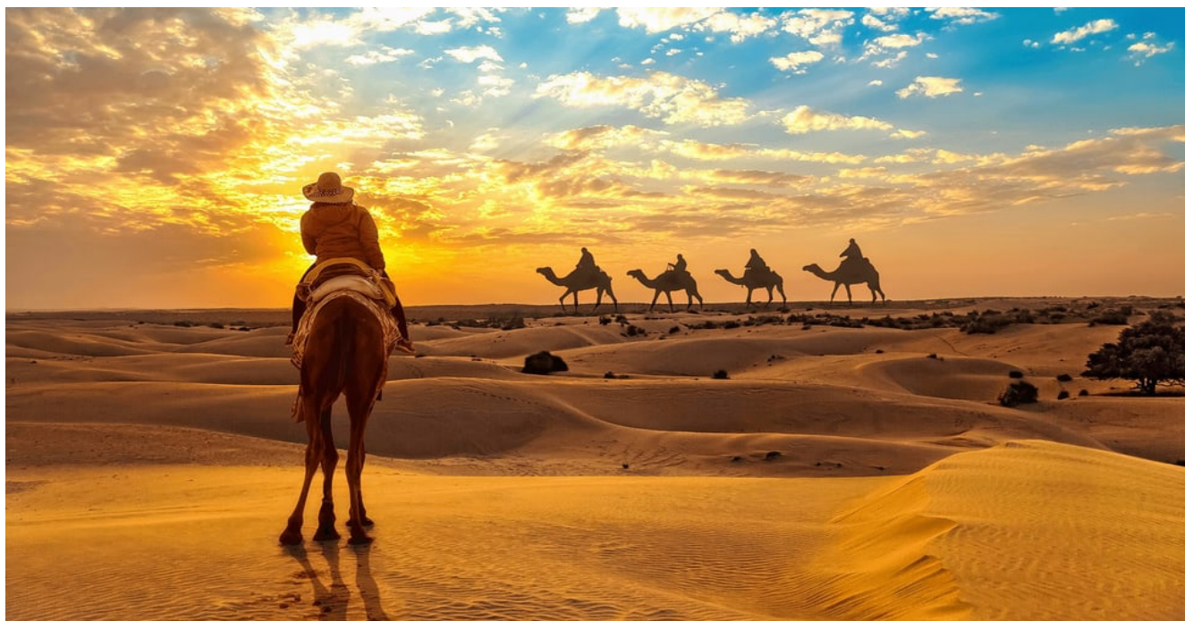
Adentrándonos, desde Jaisalmer, en el Desierto del Thar