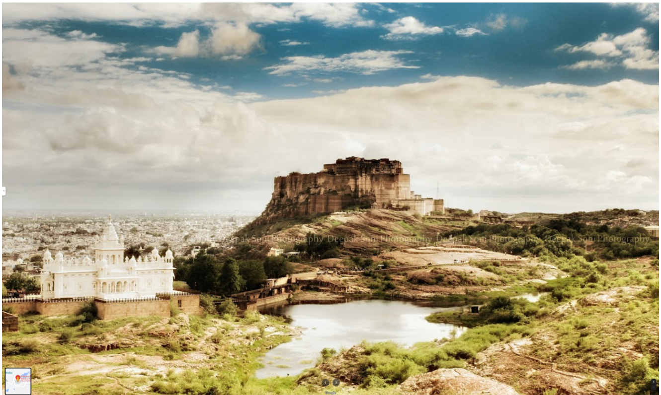
Fuerte de Mehrangarh en el centro y Jaswant Thada (cenotafio real) en esquina inferior izquierda (Jodhpur)