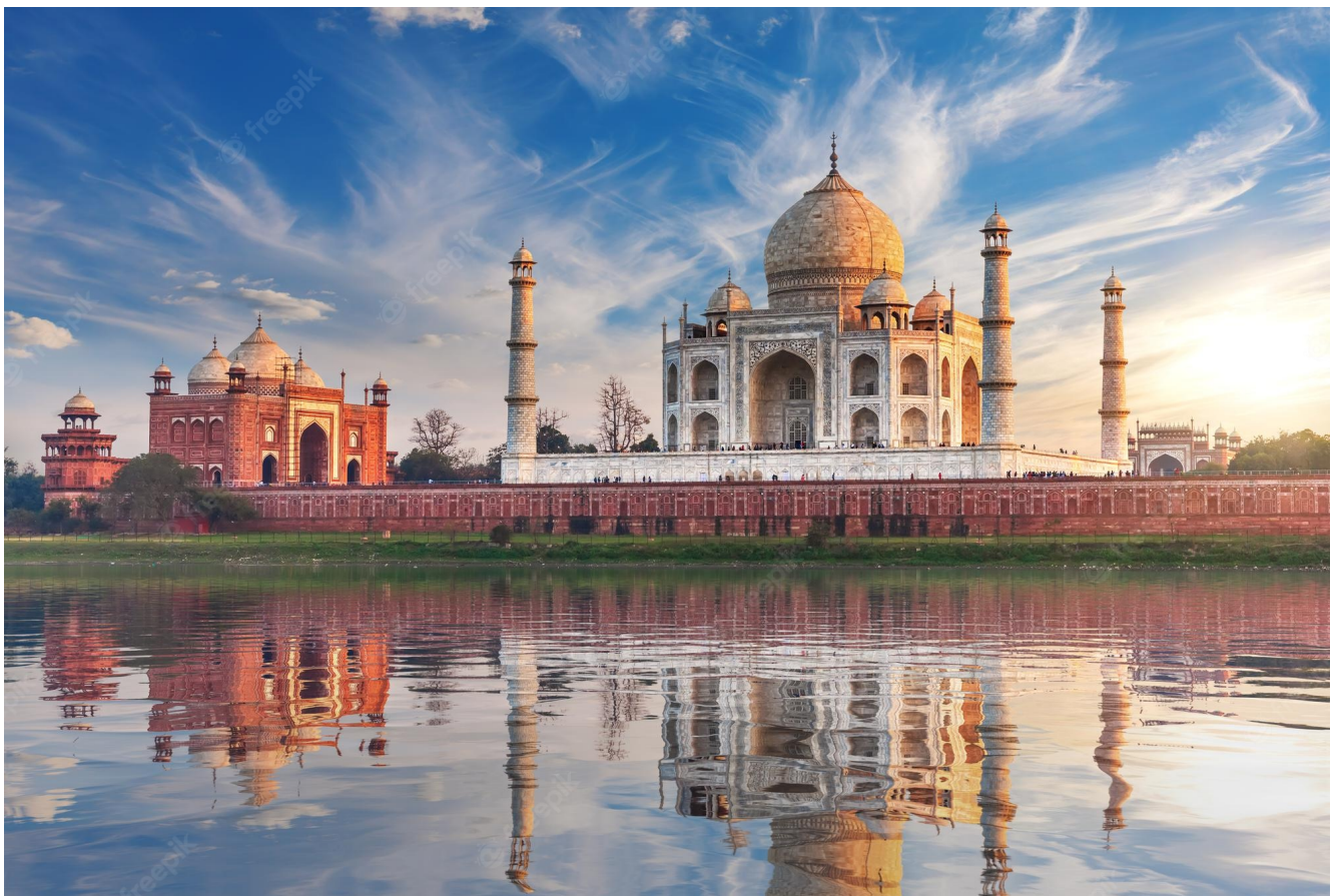
El Taj Mahal visto desde el Río Yamuna, Agra.

Nuestro segundo vuelo desde Doha, aterriza en Madrid Barajas a las 6:50am