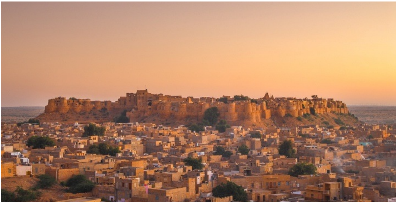
La Ciudad Dorada de Jaisalmer , rodeada por el Desierto de Thar

El viaje se puede hacer en su versión completa entrando el día 20 de febrero por Ahmedabad e incluyendo Mt. Abu y la Sede Central de Brahma Kumaris , o parcialmente en su versión más corta para los que ya han hecho el viaje clásico en el pasado y que por tanto ya conocen esa primera parte, entrando por Jodhpur el 24 de febrero, ambos terminando el día 3 de marzo en Delhi, o continuando con el retiro latino en ORC hasta el 9 de marzo. Además, se incluye una extensión muy completa, para aquellos que vayan al retiro y que quieran conocer el Taj Mahal y el lugar de nacimiento de Krishna , según la mitología hinduista y el conocimiento ancestral del Raja Yoga, el príncipe que se convertiría en el primer emperador de la humanidad que reinó a orillas del río Yamuna (Mathura), en el principio de los tiempos en la Edad de Oro.