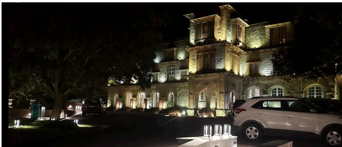
Bikaner House Place Hotel en Mount Abu (Rajasthan).