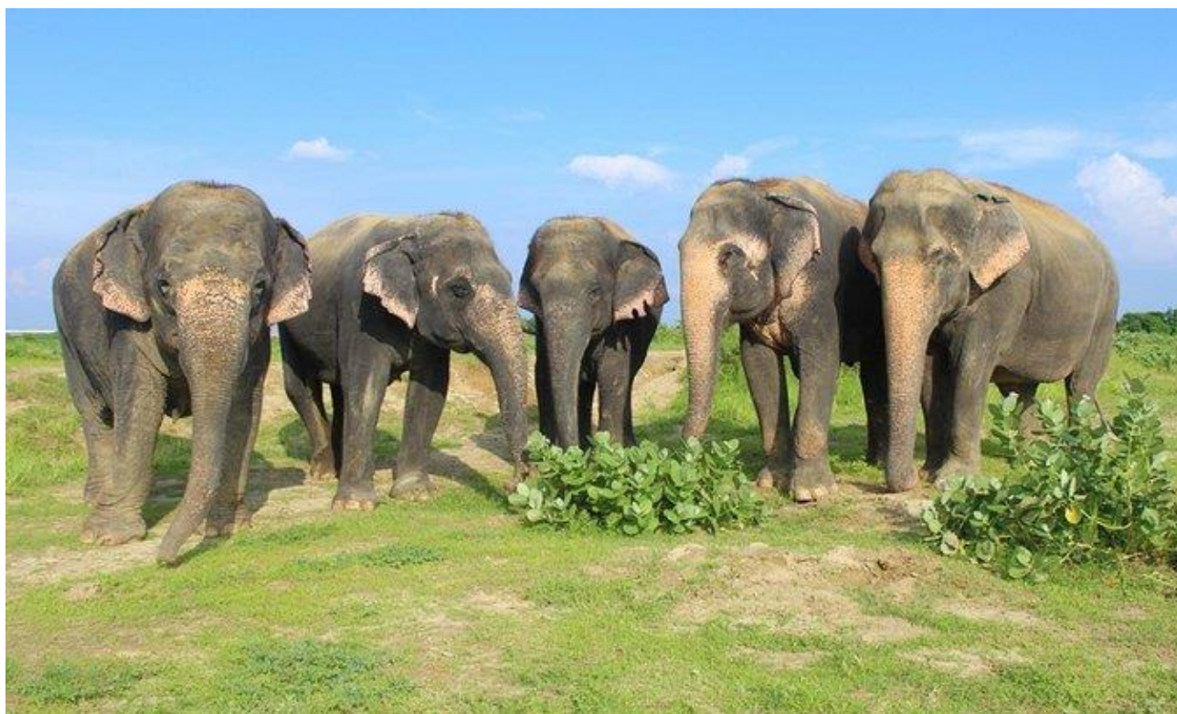
Centro de Conservación de Elefantes (Wildlife SOS), Agra

NEPAL: Katmandú, capital de Nepal – Templo de Monos de Swayambhunath – y en Boudhanath la estupa más grande de Nepal, entre otras visitas, para salir de Katmandú y dirigirnos a la montaña hasta el Mirador al Himalaya de Nagarkot, donde además tendremos un día libre para explorar y hacer excursiones y senderismo , además de visitar al día siguiente con otra caminata, el Templo Changu Narayan , el más antiguo templo hinduista de Nepal. Final y opcionalmente, existe la posibilidad de realizar un vuelo panorámico sobre el Monte Everest . El vuelo de regreso a España será directamente desde Katmandú.