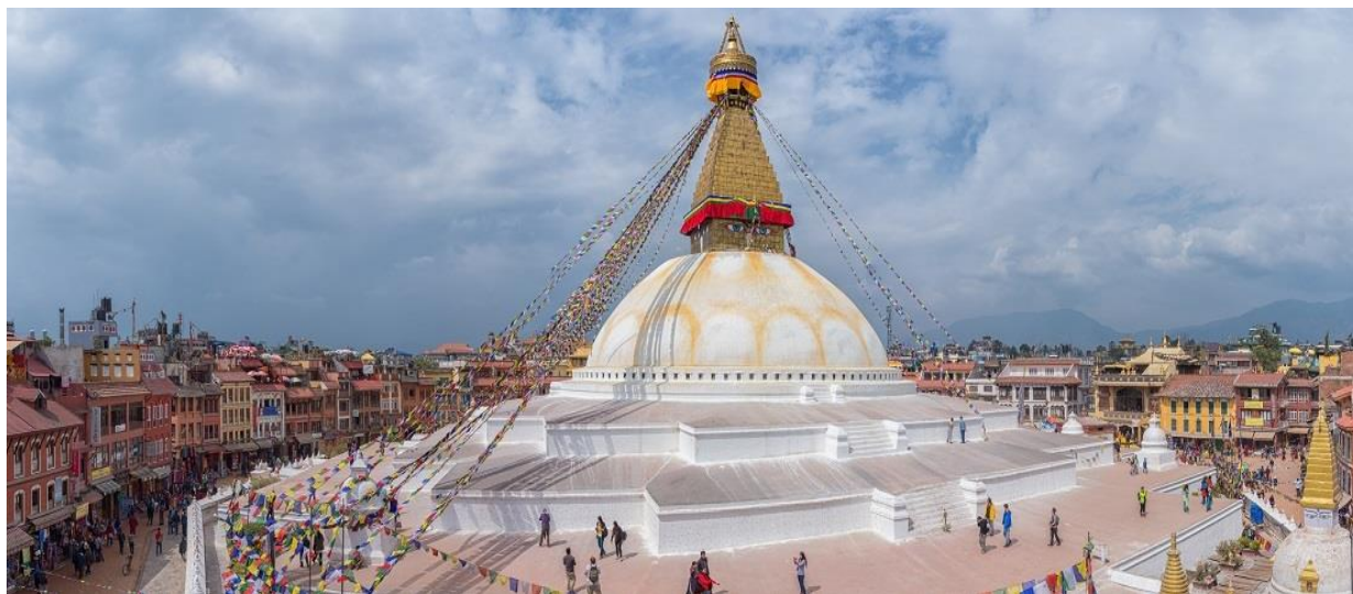
Estupa de Boudhnath en Katmandú (Nepal)