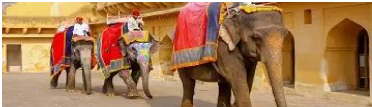
Elefantes del Fuerte Amber a las afueras de Jaipur

Se ruega proteger, en la medida de lo posible, este itinerario frente a agencias de viajes o agencias locales, y queda reservado llevarse a cabo, de esta forma exclusivamente con Pure Expeditions