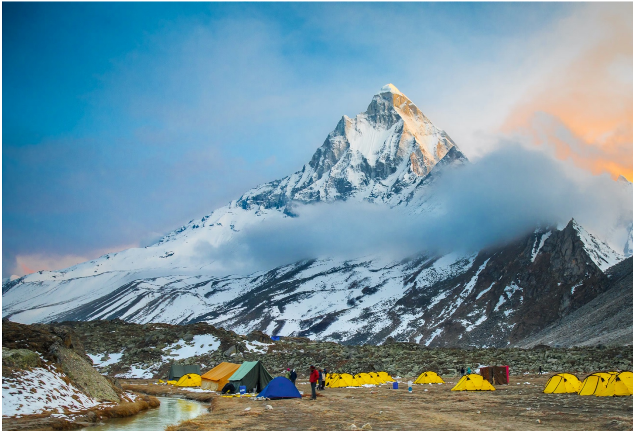
Vista del Mt. Shivlig desde el Campamento de Tapovan

El viaje se realiza en agosto y septiembre época y final de monzón, por lo que podemos esperar algo de precipitaciones, aunque puede resultar agradable, dado que las temperaturas descienden en el Rajastán y transforman su paisaje árido. En Anantapur (Fundación Vicente Ferrer) algunos años llueve, otros años no, por lo que muchos españoles viajan en agosto y el trekk en Uttrakand, lo dejamos para el final del viaje cuando el monzón ya está terminando y así poder disfrutar el máximo de esta preciosa aventura de cinco días en el Himalaya.