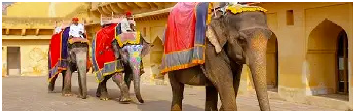
Elefantes del Fuerte Amber a las afueras de Jaipur