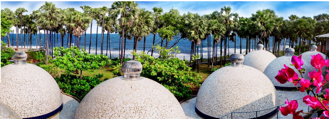
Quiet Healing Center, Quiet Beach (Auroville)